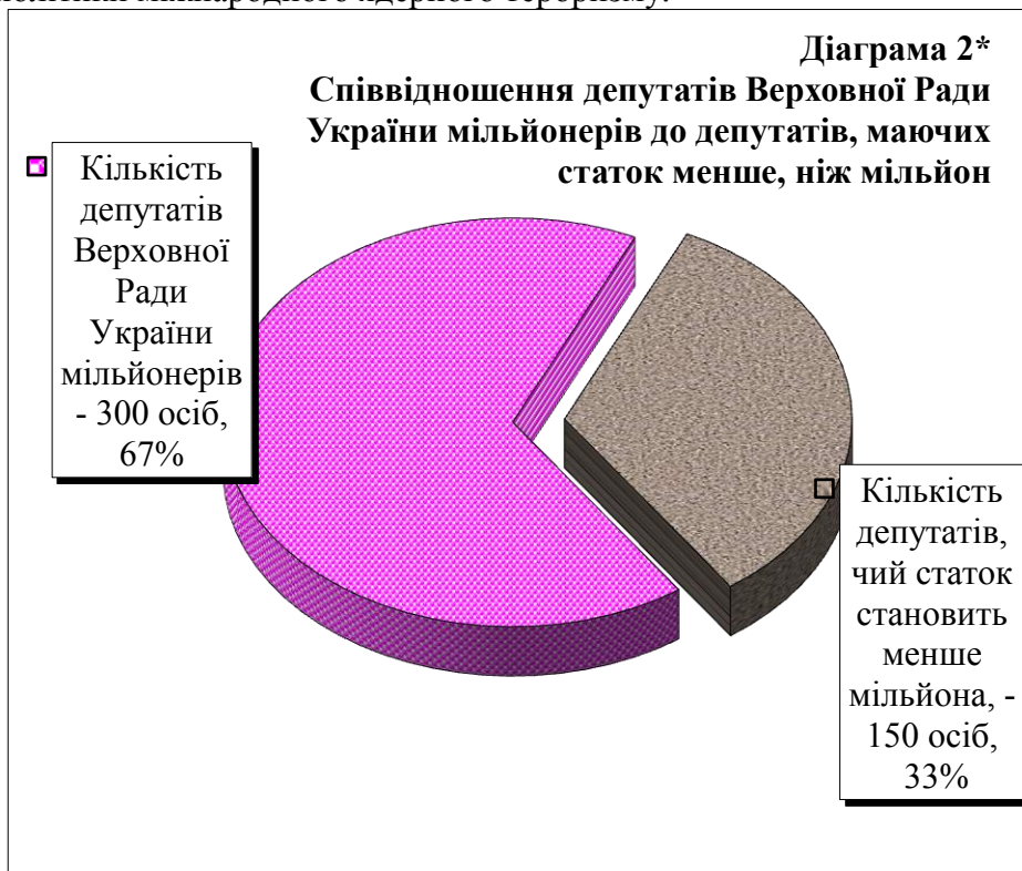
Діаграма № 2 [15, с. 394].

наслідок – екстенсифікація економіки і соціальний дарвінізм сфери суспільних відносин, а зрештою – повномасштабний колапс. Унаслідок, псевдоеліти із ситуації, що склалася, вимушені будуть шукати вихід. Цей вихід – перевід внутрішніх проблем у площину зовнішньої політики – пошук зовнішнього ворога. Це, насамперед, пошук зовнішньої військової загрози і, як наслідок, спроба консолідації суспільства для протистояння «зовнішнім» викликам. Ознаки такої зовнішньої політики вже зараз простежуються в передвиборній риториці сучасних російських лідерів, передусім у контексті переозброєння армії. Росія прагне відновити своє панування на пострадянському просторі, спираючись на власний ядерний статус, який безальтернативно підштовхує її в річище політики міжнародного ядерного тероризму.